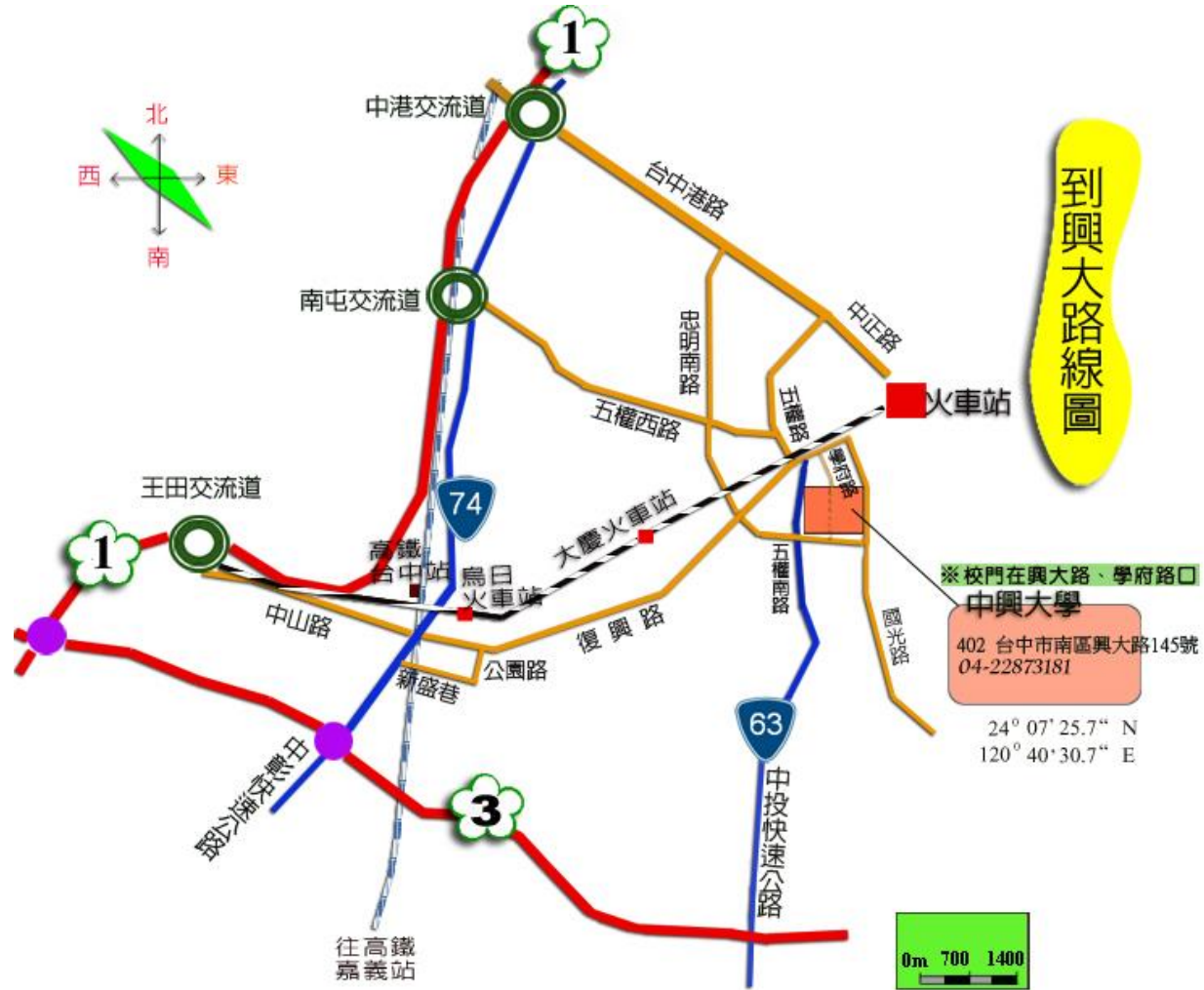
【高速公路與快速道路圖】