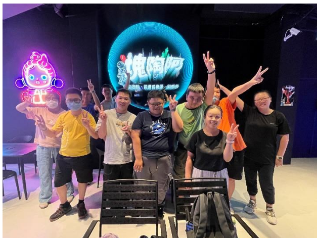
圖左：闖關結束後，全體參與者大合照